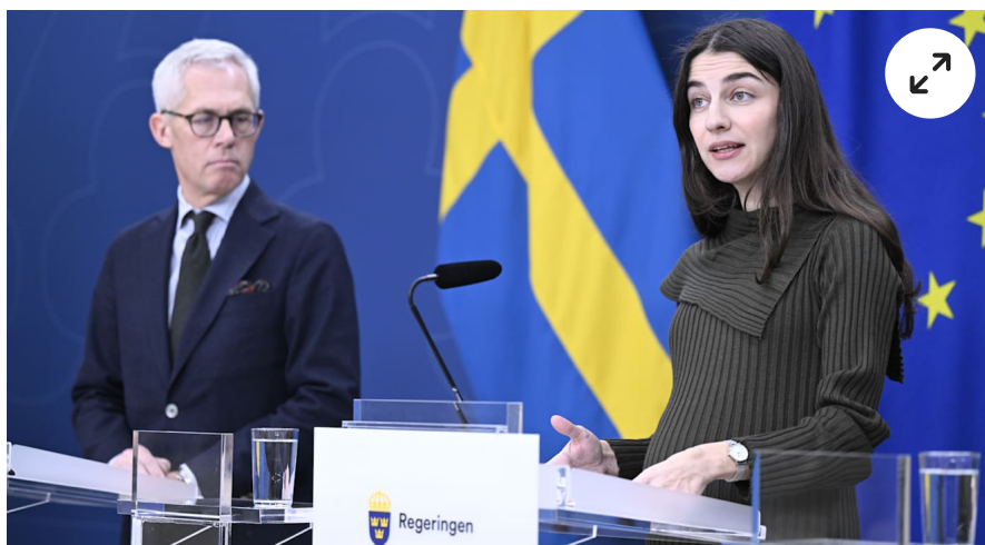
Klimat- och miljöminister Romina Pourmokhtari.

Situationen i Östersjön är akut. Strömming och sill – grundpelare i ekosystemet – har minskat kraftigt. Även vildlaxen hotas när födotillgången försvinner. Erfarenheterna visar tydligt att det storskaliga industriella trålfisket nära kusten är en avgörande orsak. Trots detta tillåts industritrålare fortfarande att fiska längs stora delar av Östersjökusten, med förödande konsekvenser för ekosystem och kustsamhällen.